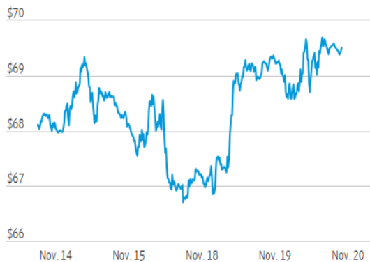
Crude Oil Futures