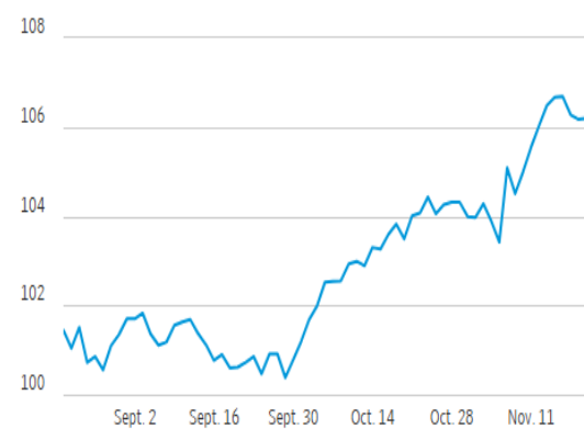
U.S. Dollar Index