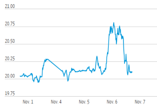
Mexican Peso (USD/MXN)

El peso mexicano recupera algo de terreno frente al dólar después de alcanzar un mínimo de dos años y cotizar hasta en $20.74 y por el momento se mantiene relativamente estable, más cerca de los $20.00, mientras los inversionistas digieren la victoria del ex presidente Donald Trump. Para los próximos días la FED y Banxico serán factor. Se espera que el día 7 la FED baje 25 puntos base su tasa y las expectativas siguen siendo elevadas para que Banxico haga lo mismo y recorte las tasas de interés en 25 pb para dejar su tasa de referencia en 10,25% en su reunión del 14 de noviembre. Esto podría ejercer presión sobre el peso, ya que las tasas de interés más bajas atraen menos entradas de capital extranjero. En el mercado de deuda, las cifras de empleo en Estados Unidos motivaron un rally de hasta 10pb en la parte corta de la curva de rendimientos. Sin embargo, el movimiento se diluyó por completo. El consenso no espera sorpresas en el comunicado ni en la conferencia de prensa de Powell, y se pudiera esperar que los próximos recortes serán a un ritmo gradual, pero sin una pausa.