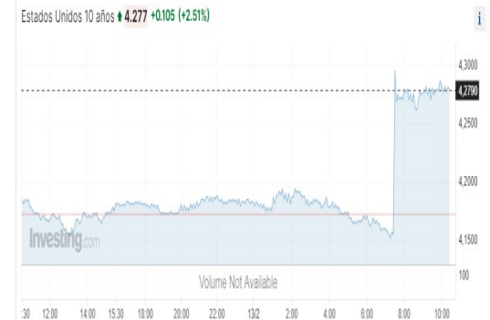
Estados Unidos 10 años \uparrow 4.277 +0.106 (+2.51%) Bono de EU a 10 años 13/02/2024. Reaccionando a la Inflación en EU.

El mercado de renta fija también reaccionó a la publicación de los datos de inflación en Estados Unidos. Las cifras correspondientes al mes de enero han sido más altas de lo que esperaba el consenso. Así, la inflación en término interanual sube 3,1% con respecto a diciembre, más alto que el 2,9% esperado. Noticias que apuntará la Reserva Federal estadounidense (Fed) de cara a su próxima reunión de tipos de interés. El dato de inflación reafirma la expectativa de que la Reserva Federal será cautelosa con los recortes a la tasa de interés. Powell el presidente de la FED en el programa “60 minutos”, reafirmó que no es probable que la FED llegue a los niveles de confianza sobre la trayectoria de la inflación para la siguiente reunión de política monetaria en marzo próximo y que no espera un cambio en las expectativas de la FED. De ahí que los analistas estiman que el primer ajuste en la tasa podría venir en el segundo semestre del año y solo podrían ser 3 movimientos para cerrar el 2024 con una tasa estimada. del 4.25%. En el mercado local, Banxico señaló en su comunicado que “...en las siguientes reuniones evaluará, en función de la información disponible, la posibilidad de ajustar la tasa de referencia...”. Esto provocó que los inversionistas reforzaran su expectativa de un recorte de 25pb para la reunión de marzo. Todo dependerá de la inflación.